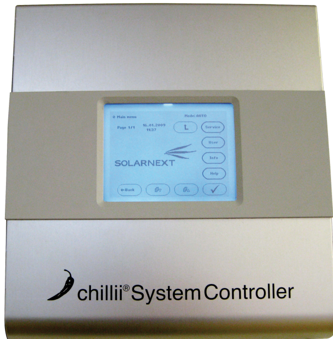
▲ Abbildung 1 chillii® System Controller HC